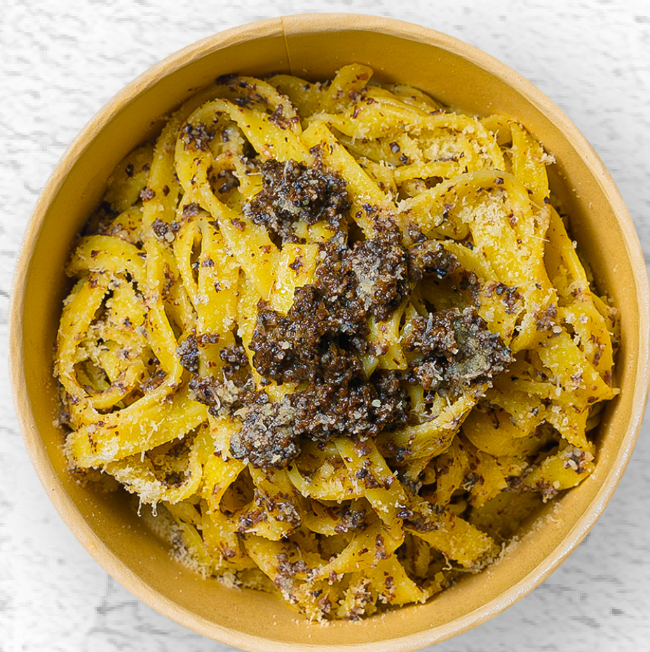
FETTUCCINE CON FUNGHI E TARTUFO FETTUCCINE TRUFFLE, MUSHROOMS & PARMESAN CHEESE

RAVIOLI DI RICOTTA E SPINACI CON FUNGHI E TARTUFO