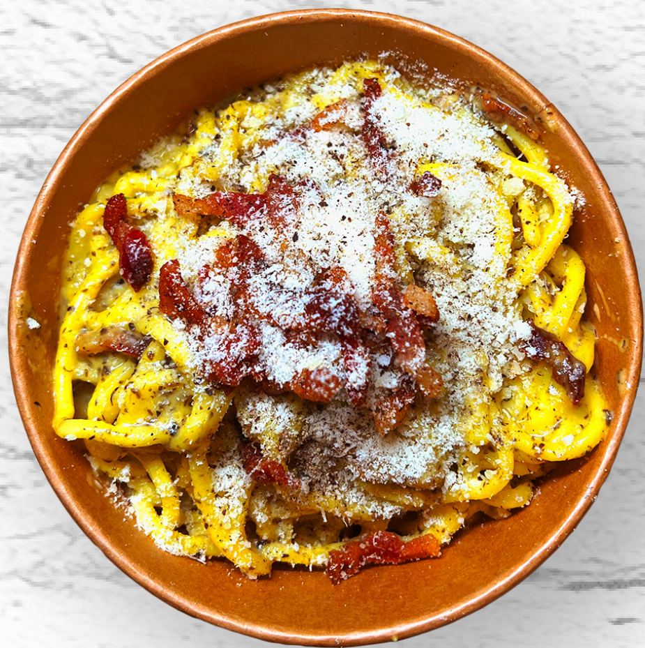
TONNARELLI ALLA CARBONARA TARTUFATA TONNARELLI PORK CHEEK, EGGS, PECORINO CHEESE & TRUFFLE