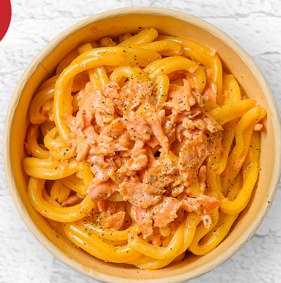
CASARECCE CON SALMONE AFFUMICATO WATER & FLOUR PASTA WITH SMOKED SALMON